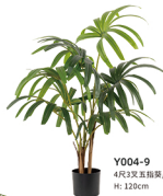
Y004-9 4尺3叉五指葵/9叶 H: 120cm