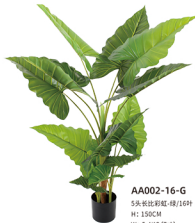
AA002-16-G 5头长比彩虹-绿/16吋 H: 150CM W: 5.4KG (7吋)