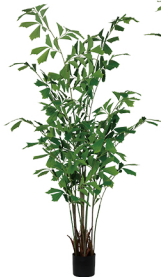
YWK-210-442 8杆鱼尾葵/442叶 H: 210CM W: 4.8KG (7寸)