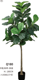
Q180 单杆琴叶栢/80吋-拆装 H: 180CM W: 4.95KG (7吋)