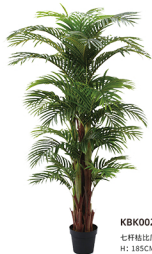
KBK002-36 七杆粘比凤尾葵/36叶 H: 185CM