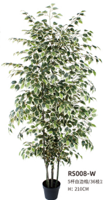
R5008-W 5杆白边栎/36枝1512叶 H: 210CM