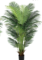
K185 股管24头凤尾葵/24叶 H: 185CM W: 6.2KG (7寸)