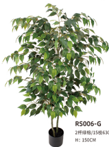
R5006-G 2杆绿栎/15枝630叶 H: 150CM