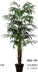
480-18-54 18头股掌3叉燕尾竹/18-54叶 H: 170CM