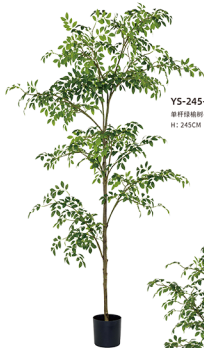
YS-245-1890 单杆绿楠树-拆装/1890叶 H: 245CM