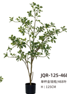
JQR-125-468 单杆金钱榕/468叶 H : 125CM