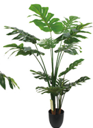
GBZ-004 2头长比龟背竹/12叶 H: 120CM