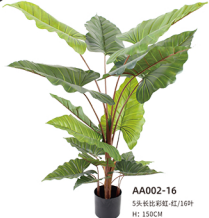
AA002-16 5头长比彩虹-红/16吋 H: 150CM W: 5.4KG (7吋)