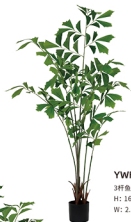
YWK-160-185 3杆鱼尾葵/185叶 H: 160CM W: 2.5KG (6寸)