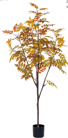
QMY-190-864-R CH09杆漆木叶/864叶 H : 190CM