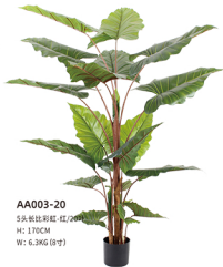
AA003-20 5头长比彩虹-红/20吋 H: 170CM W: 6.3KG (8吋)