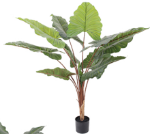
AA0012-10 单头长比彩虹-红/10吋 H: 130CM W: 3.2KG (6吋)