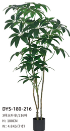
DYS-180-216 3杆大叶伞/216叶 H: 180CM W: 4.8KG (7寸)