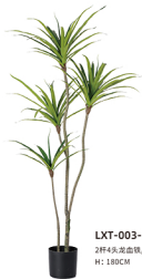
LXT-003-G 2杆4头龙血铁/72吋-绿 H: 180CM