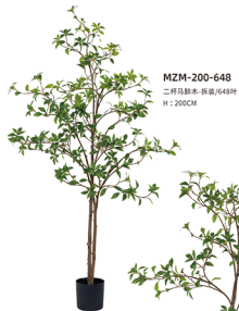
MZM-200-648 二杆马褂木-拆袋/648叶 H : 200CM