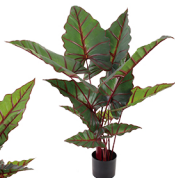
WHY005 4头网红芋/11叶 H: 120CM W: 1.87KG (7寸)