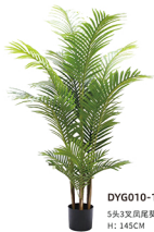
DYG010-15 5头3叉凤尾葵/15叶 H: 145CM