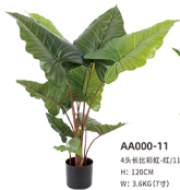
AA000-11 4头长比彩虹-红/11吋 H: 120CM W: 3.6KG (7吋)