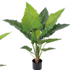
GYK004 单杆扇叶观音莲/13叶 H: 100CM W: 2.52KG (6寸)