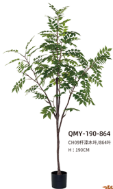
QMY-190-864 CH09杆漆木叶/864叶 H : 190CM