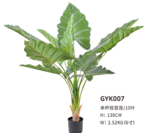
GYK007 单杆观音莲/10叶 H: 130CM W: 2.52KG (6寸)