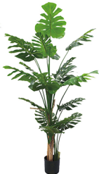
GBZ-006 3种兼叶龟背竹/20叶 H: 170CM