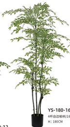
YS-180-16-白边 4杆白边楠树/16枝 H: 180CM