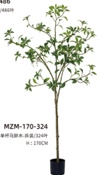
MZM-170-324 单杆马褂木-拆袋/324叶 H : 170CM