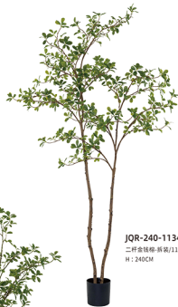
JQR-240-1134 二杆金钱榕-拆装/1134叶 H : 240CM