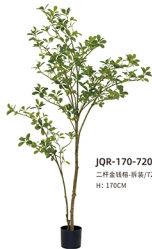
JQR-170-720 二杆金钱榕-拆装/720叶 H : 170CM