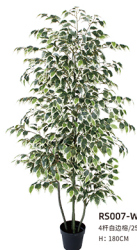
R5007-W 4杆白边栎/25枝1050叶 H: 180CM