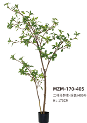
MZM-170-405 二杆马褂木-拆袋/405叶 H : 170CM