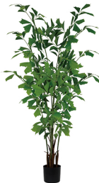
YWK-190-371 5杆鱼尾葵/371叶 H: 190CM W: 4.8KG (7寸)