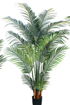
K150 旅葵/15叶 H: 150CM W: 3.95KG (6寸)