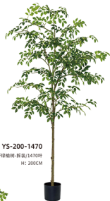
YS-200-1470 单杆绿楠树-拆装/1470叶 H: 200CM