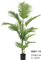
A001-15 竹节葵/15叶 H: 160CM