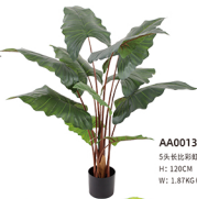
AA0013-11 5头长比彩虹-红/11吋 H: 120CM W: 1.87KG (6吋)