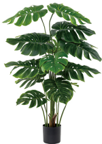
JKKX-145-15 吉祥开口笑/15叶 H: 145CM W: 4.5KG (7寸)