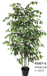
R5007-G 4杆绿栎/25枝1050叶 H: 180CM