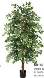
OR180 2杆绿栎-转装/1366叶 H: 180CM W: 5.8KG (7寸)