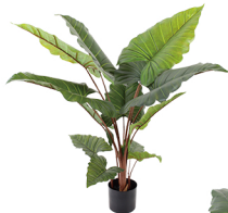
AA001-13 4头长比彩虹-红/13吋 H: 130CM W: 4KG (7吋)