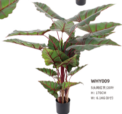
WHY009 5头网红芋/20叶 H: 170CM W: 6.1KG (8寸)