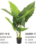
AA000-11-G 4头长比彩虹-绿/11吋 H: 120CM W: 3.6KG (7吋)