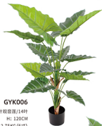
GYK006 二头扇叶观音莲/14叶 H: 120CM W: 2.75KG (6寸)