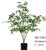
YS-110-630 单杆绿楠树/630叶 H: 110CM