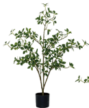
DQ-105-450 单杆冬青/450叶 H : 105CM