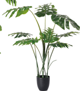
GBZ-009 特型龟背竹/10叶 H: 120CM