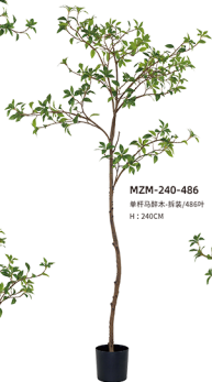
MZM-240-486 单杆马褂木-拆袋/486叶 H : 240CM