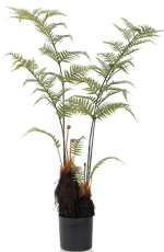
JSJ-6# H: 160CM