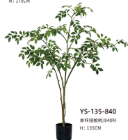
YS-135-840 单杆绿楠树/840叶 H: 135CM