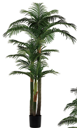
SWK-190-26 大三杆散尾葵/26叶 H: 190CM W: 8.75KG (8寸)