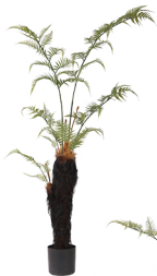
JSJ-2# H: 180CM