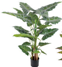
GYK009 5头观音莲/20叶 H: 170CM W: 6.1KG (8寸)