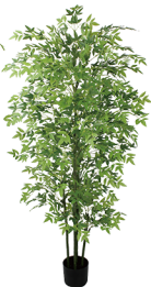
Z180 五杆南天竹-拆装/1155叶 H: 180CM W: 5.2KG (7寸)