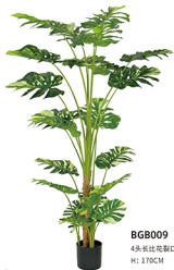
BGB009 4头长比花箭口/23叶 H: 170CM