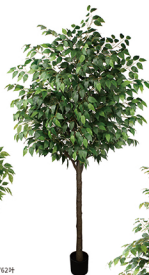
B210 单杆绿栎树/36枝 H: 210CM