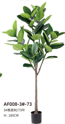
AF008-3#-73 3#橡皮树/73叶 H: 180CM