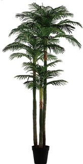
SWK-250-39 大三杆散尾葵/39叶 H: 250CM W: 14.6KG (10寸)