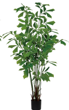
YWK-160-277 4杆鱼尾葵/277叶 H: 160CM W: 3.1KG (6寸)