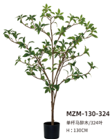
MZM-130-324 单杆马褂木/324叶 H : 130CM