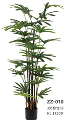
ZZ-010 3叉榕竹/27叶 H: 175CM