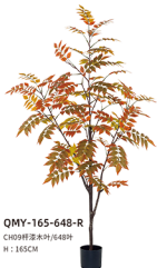
QMY-165-648-R CH09杆漆木叶/648叶 H : 165CM