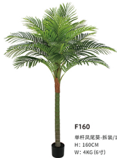
F160 单杆凤尾葵-拆袋/18叶 H: 160CM W: 4KG (6寸)