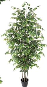
R5008-G 5杆绿栎/36枝1512叶 H: 210CM