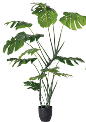
GBZ-007 特型龟背竹/13叶 H: 170CM