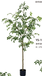
YS-175-910 单杆绿楠树-拆装/910叶 H: 175CM