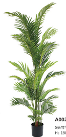
A002-24 5头竹节葵/24叶 H: 190CM