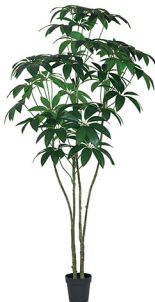
DYS-220-288 2杆4头大叶伞/288叶 H: 220CM W: 7KG (8寸)