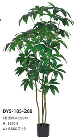
DYS-185-288 4杆大叶伞/288叶 H: 185CM W: 5.5KG (7寸)