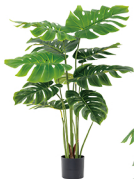
JKKX-120-10 吉祥开口笑/10叶 H: 120CM W: 2.7KG (6寸)