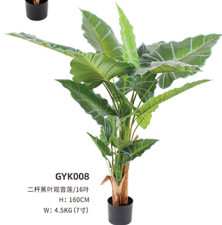
GYK008 二杆扇叶观音莲/16叶 H: 160CM W: 4.5KG (7寸)