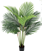
K120 股管凤尾葵/9叶 H: 120CM W: 2.3KG (5寸)