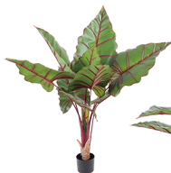
WHY007 单杆扇叶网红芋/10叶 H: 130CM W: 2.52KG (6寸)