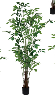
YWK-230-421 鱼尾葵/421叶 H: 230CM W: 5.5KG (7寸)