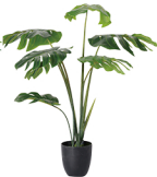
GBZ-003 特型龟背竹/7叶 H: 110CM