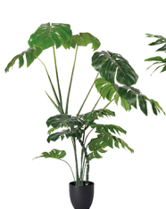
GBZ-005 特型龟背竹/14叶 H: 150CM