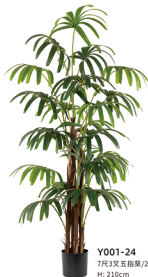
Y001-24 7尺3叉五指葵/24叶 H: 210cm