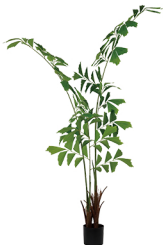
YWK-180-140 2杆鱼尾葵/140叶 H: 180CM W: 2.6KG (6寸)