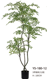
YS-180-12 3杆楠树/12枝 H: 180CM