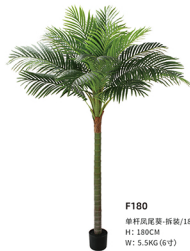
F180 单杆凤尾葵-拆袋/18叶 H: 180CM W: 5.5KG (6寸)