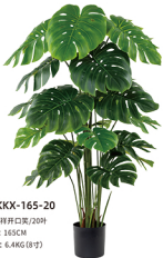
JKKX-165-20 吉祥开口笑/20叶 H: 165CM W: 6.4KG (8寸)