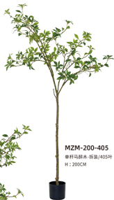
MZM-200-405 单杆马褂木-拆袋/405叶 H : 200CM