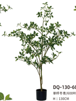
DQ-130-600 单杆冬青/600叶 H : 130CM