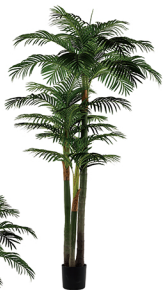
SWK-220-33 大三杆散尾葵/33叶 H: 220CM W: 9.45KG (8寸)