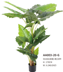
AA003-20-G 5头长比彩虹-绿/20吋 H: 170CM W: 6.3KG (8吋)