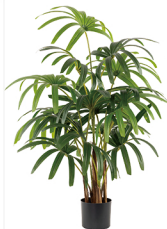
Y003-15 5尺3叉五指葵/15叶 H: 160cm