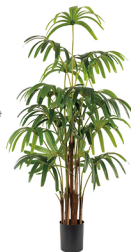
Y002-21 6尺3叉五指葵/21叶 H: 180cm