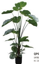
QPG-002 3种青苹果/23叶 H: 150CM