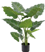
GYK005 4头观音莲/11叶 H: 120CM W: 1.87KG (7寸)