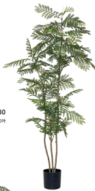
LHY-190-63 3杆2亩花糖/63叶 H : 190CM