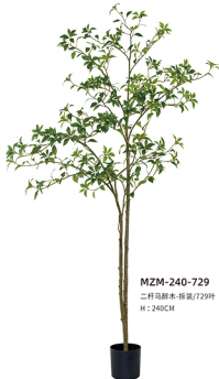
MZM-240-729 二杆马褂木-拆袋/729叶 H : 240CM