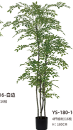
YS-180-16 4杆楠树/16枝 H: 180CM