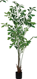
YWK-210-256 3杆鱼尾葵/256叶 H: 210CM W: 4.1KG (7寸)