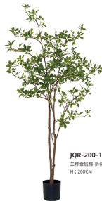
JQR-200-1008 二杆金钱榕-拆装/1008叶 H : 200CM